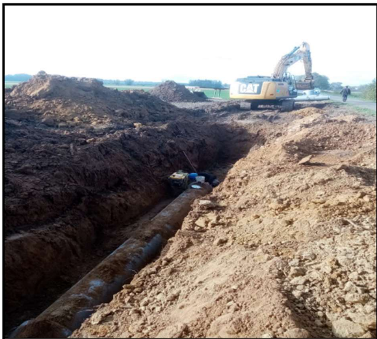
Photo du chantier le long de la piste cyclable

L'entreprise Rott est en train de terminer la mise en place du nouveau réseau d'assainissement gravitaire de Hatten vers la station d'épuration pour remplacer un réseau qui passe dans la zone d'activité et qui transporte toutes les eaux usées de Rittershoffen et de Hatten vers la station d'épuration en les pompant avec une station de refoulement. Le coût de ces travaux s'élève à 547 698 € HT et l'entreprise Striebig de Hatten participe au financement de ce chantier à hauteur de 350 000 € HT car elle veut devenir propriétaire de la rue Gutenberg dans laquelle passe actuellement le réseau d'assainissement reliant Hatten à la station d'épuration. Ce nouveau réseau nous permettra d'éviter le pompage des eaux usées de Rittershoffen et de Hatten, contribuant ainsi à une économie d'électricité et de coûts d'entretien non négligeables.