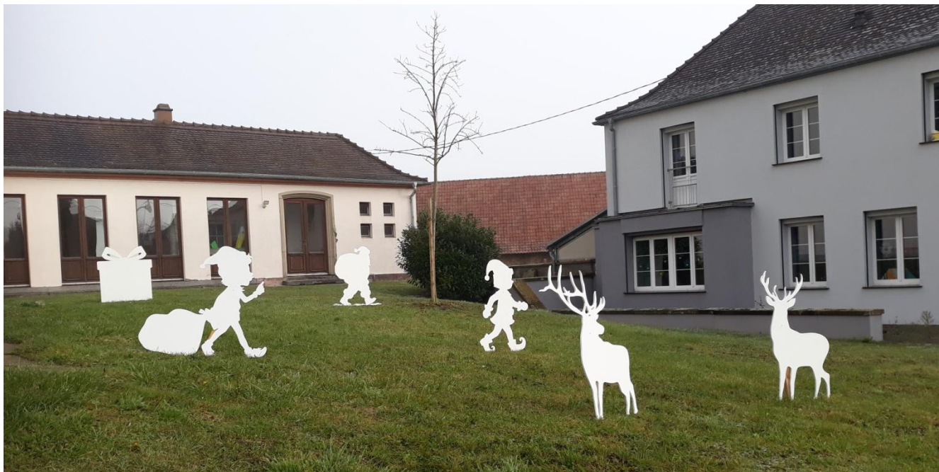
Nouvelles figurines mises en place en ce temps de l'Avent.