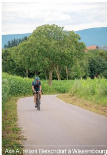
Axe A, reliant Betschdorf à Wissembourg

Des travaux ambitieux qui représentent un investissement conséquent, avec un coût de 2,8 millions d'euros pour l'Axe A et 2,2 millions d'euros pour l'Axe B, soutenus à hauteur de 50% par la Collectivité.