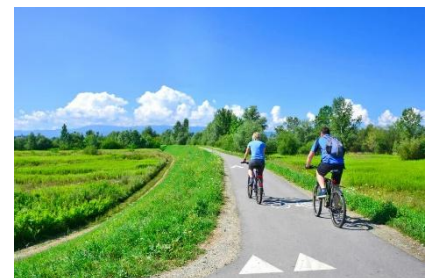
400 km de réseau cyclable en Alsace du Nord

La nécessaire transition climatique ne peut se faire que si elle est partagée par tous les acteurs du territoire. Que nous soyons élus, associatifs, entrepreneurs ou citoyens du territoire, nous avons tous un rôle crucial à jouer pour atteindre collectivement les objectifs et limiter nos impacts sur l'environnement.